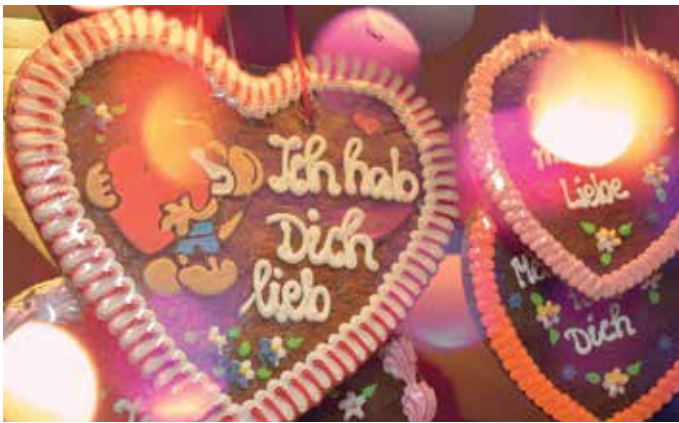
Unterhaltung für Groß und Klein