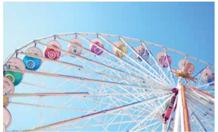
Thementage im Vergnügungspark