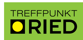
Tourismusverband Ried Hotelinformation: Tel. 0043-(0)7752-85180 www.ried.com